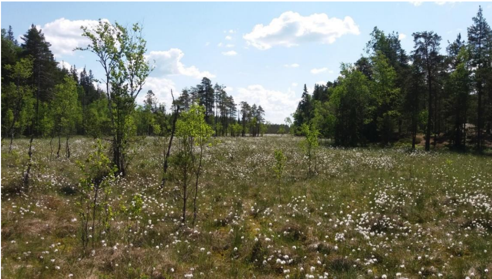
Kurjenrahkan kansallispuiston tupasvillasuota.

Päivän lämmentyä kävimme jaloittelemassa myös kansallispuiston ”pääpaikalla” Kurjenpesän luontotuvan ympäristössä ja Rouva tietenkin uimassa. Huh huh.