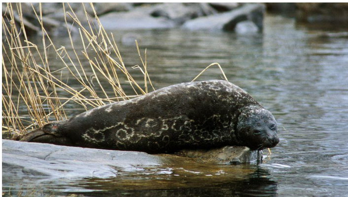
Googlen paras norppakuva.

Haukiveden erikoisuus on kuitenkin Saimaan norppa. Niillä on vakiopaikkoja, joissa ne oleskelevat ja pesivät. Yksi hyvistä havaintopaikoista on Linnansaaren pohjoispäässä sijaitseva Linnavuori, jonka laelta voi kaukoputkella ja kiikareilla useinkin nähdä norpan läheisellä pitkulaisella luodolla. Ehkä itse ”Nestori”.