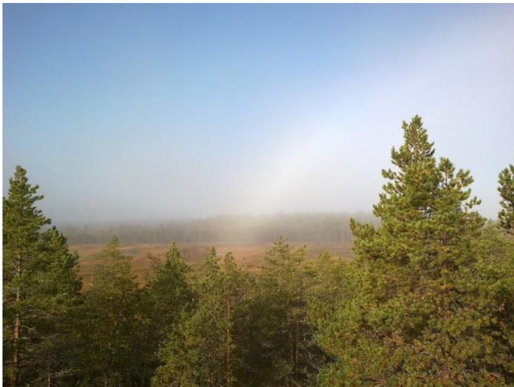
Sumukaaren päässä on aarre, Patvinsuo