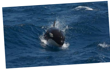
sporttinen miekkavalas vauhdissa

Valas hyppäsi osittain koholle merestä, tylppä pää kohosi vauhdilla ja meri kuohui valkoisena. keho pamahti veteen ja pärskeet lensivät sivulle metrien korkeuteen ja päähän. Kohta samanlainen hyppy suoraan satamaa kohti ja valaan pisaranmuotoinen poikkileikkaus näkyi upeasti. Korkea selkäevä ja valkea vatsa kuohujen seassa. Kohta näkyi vesisuihku ja sitten syvyyteen sukeltavan valaan pyrstö kohosi vedestä. Voi perskutarallaa, uskomatonta, kannatti elää tähän päivään saakka. Nyt vaikka harmaakaihi saa tulla. Noiden suurten hammasvalaiden, miekkavalaiden, iloittelua ja rajua kalastusta näkyi kymmenkunta minuuttia. Ne olivat koonneet porukalla kalaparven, kattaen näin lounaansa lahdelle. Istuimme onnesta sykkyrässä laiturilla ja sain osakseni kovasti kiitosta reittivalinnastani. Ensin oikea jäävirta ja nyt miekkavalaita. Haaveemme oli toteutunut ja näimme valaat paremmin kuin merelle järjestetyissä, aallokossa pahoinvointia aiheuttavista, järjestetyistä valassafareista. Ainakin jos uskomme internet kirjoituksiin valassafareista ja miksipä emme uskoisi.