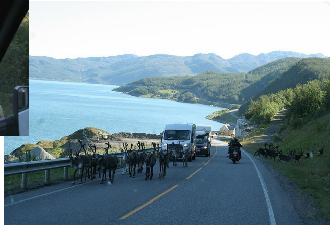
Pärrä-enkelit johdattivat sarvipääruuhkan läpi.

Nisäkkäitä siis nähtiin, mutta kovasta tähystyksestä ja tauoista huolimatta enemmiltä valashavainnoilta vältyttiin ja niin matka edistyi Altan kaupunkiin. Olimme nyt siinä, mistä seikkailun oli ollut tarkoitus alkaa.