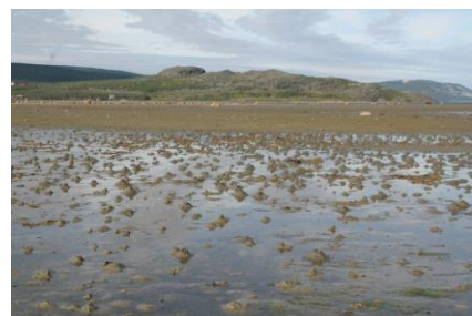
suokukko ja liejumatoja

Kokonaisuudessaan reissu jäi lintujen osalta valaiden varjoon, eikä eliksiä saatu. Toiveina olivat olleet torvinokkainen myrskylintu ja joku keijulaji jäämeren rannalta. Olimme myöhässä. Suuri osa linnuista oli jo lähtenyt pesimäalueiltaan maailmalle (ja merelle).