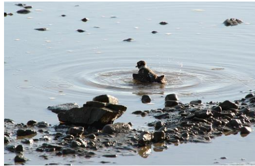
Kylpijä suolavedessä. Laskuveden aikaan pienen kahlaajan, tyllin, jalat ylsivät pohjaan.

Ohitimme tutun paikan tällä kertaa nopeasti, sillä laskuvesi oli alkamassa ja oli kiire Rässivuonon matalikolle odottamaan saapuvia lintuja. Kahlaajasumaa ei kuitenkaan tullut katsottavaksi. Eihän vuono ollutkaan lintuharrastajien suosima.