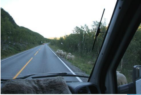
Tunturikoivikossa kasvoi lampaista.