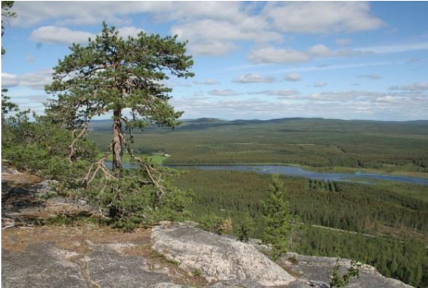
upeaa näköalaa Aavasaksan vaaralta

Seuraavana päivänä alkoi sitten se pidempi ajomatka heti aamusta. Tässä iässä aikainen aamuherätys on arkea lomallakin, joten seitsemältä olimme jo köröttelemässä pohjoiseen. Pieni mukava jaloitteluhetki pidettiin Aavasaksalla. Korppipoikue lenteli paikalla ja tuulihaukan näimme yläpuolelta, kun se käväisi jyrkänteen onkalossa, kahdesti. Pesintäkö?