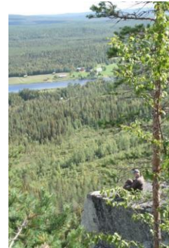
rohkea retkeilijä jyrkänteellä

Kettu ylitti tien, ja sehän tiesi onnea ketulle. Ensimmäinen nisäkäslaji tuli.