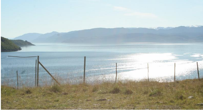
Taustalla Senjan saari

Ilmahyppyjä emme sentään nähneet. Delfiinien leuassa ja kyljissä oli selvästi erottuvia vaaleita alueita ja varmistimme jälkikäteen ne valkokuonodelfiineiksi. Jo viides valaslaji jonka olemme nähneet Pohjois-Norjassa. Kovin etäällä ne kuitenkin olivat.