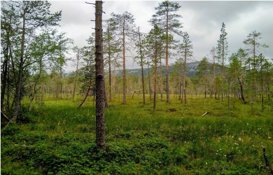
kuvassa taustalla kohoaa Noitatunturi

Ja taas aamulla ajamaan. Porot herättelivät kuskia ja rouva etsi katseellaan lakkasuota. Viimein Ranuan lähellä löytyi keltaisenaan hillasta oleva suo aivan tien vierestä ja bussipysäkki parkkipaikaksi. Eksymisvaaraa ei ollut. Painuimme siis suolle.