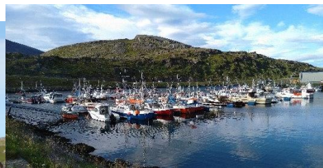
kuvia tuli lähinnä veneistä

Jäätymätön meri lienee tärkeämpi tavarankuljetusreitti kuin mutkainen maantie.