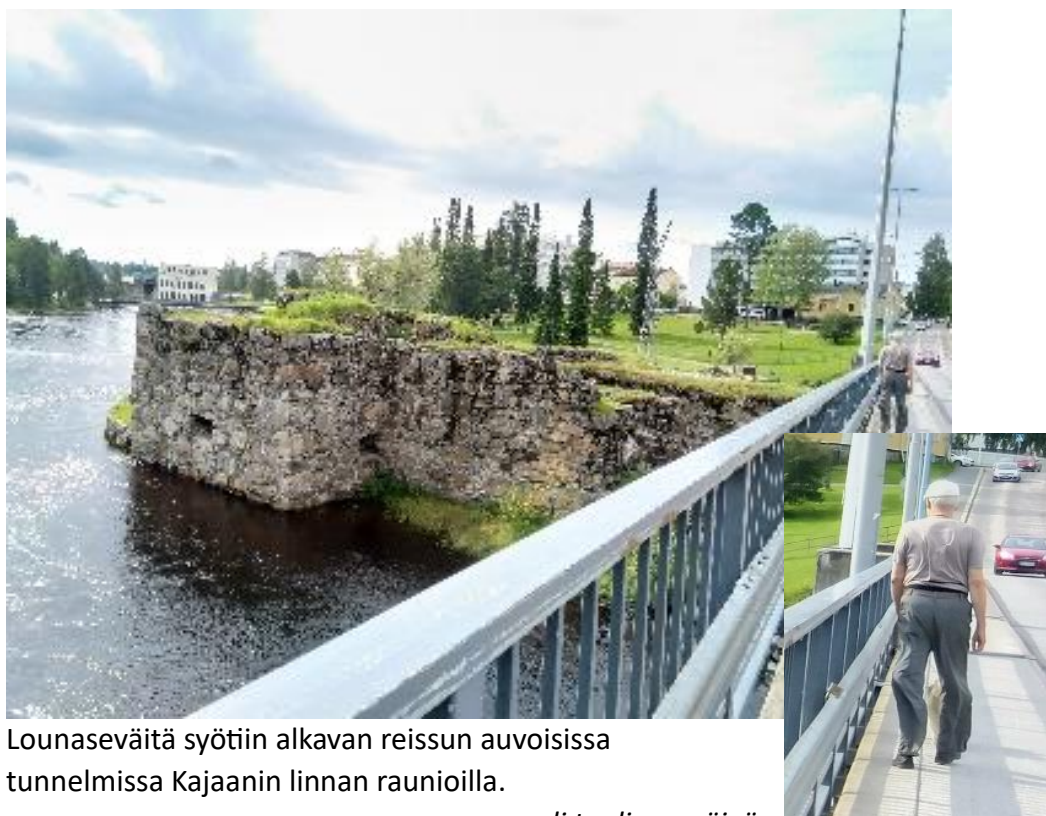
Lounaseväitä syötiin alkavan reissun auvoisissa tunnelmissa Kajaanin linnan raunioilla.

Matkaan oli varattu 11 tuntia, ajoajan ollessa 7 tuntia. Rouva ennätti hyvin käydä uimassa Paltamossa. Liikuimme omin eväin auto täynnä tavaraa. Sivuteiltä löytyi paikkoja perhepissalle, ukko, akka ja koira yhtä aikaa. Suunnitelma oli matkailla kiireettömästi Lapissa ja käväistä Pohjois-Norjassa kiikaroimassa valaita. Lintuinfluenssan takia lintupahtoja vältellen.